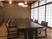
宴会場【つつじの間】