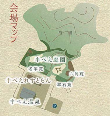
(写真の料理は一例です)

温泉 平日特典・入浴サービス 宴会の前に温泉もどうぞ。ご宴会の方は優待料金でご入浴いただけます。半べえならではの「宴会」+「温泉」。天然温泉で温まったあとは日本庭園を見ながら、ゆっくりと料理を楽しんで 例えば 17:30 送迎バスで半べえへ 18:00 半べえ温泉でひと風呂浴びてさっぱりと 18:45 宴の始まり。厳選の味覚で、お仲間たちと乾杯! 20:45 送迎バスで半べえをあとに 21:30 ただいま!