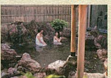
天然温泉露天風呂【赤石の庭】

温泉 平日特典・入浴サービス 宴会の前に温泉もどうぞ。ご宴会の方は優待料金でご入浴いただけます。半べえならではの「宴会」+「温泉」。天然温泉で温まったあとは日本庭園を見ながら、ゆっくりと料理を楽しんで 例えば 17:30 送迎バスで半べえへ 18:00 半べえ温泉でひと風呂浴びてさっぱりと 18:45 宴の始まり。厳選の味覚で、お仲間たちと乾杯! 20:45 送迎バスで半べえをあとに 21:30 ただいま!